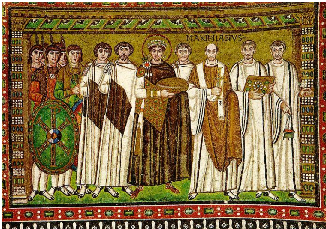
Justiniano en los mosaicos de la iglesia de San Vital en Rávena.